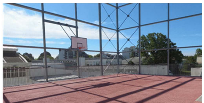
Le city park de l'internat « garçons » du lycée Jean Guéhenno, à Vannes

Lycée pro. Guéhenno à Vannes : reconstruction de l'internat « garçons » avec foyer, salle de musculation et plateau sportif de type city park (8,35 M€). Livraison fin 2024 -