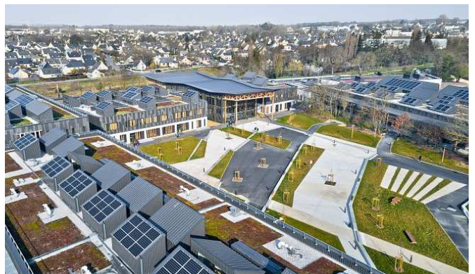
Lycée Simone Veil à Liffré

Lycée Chateaubriand à Rennes : pose, en cours, de 861 panneaux photovoltaïques sur 1 380 m 2 , après travaux d'étanchéité des toitures (670 000 €) et isolation façades. Livraison à l'été 2025.