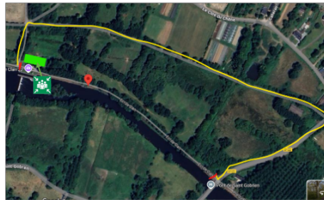
Bief 34 : Saint Jouan 1 arbre